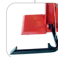
Lève-bûches de série