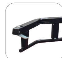
Double barres de maintien