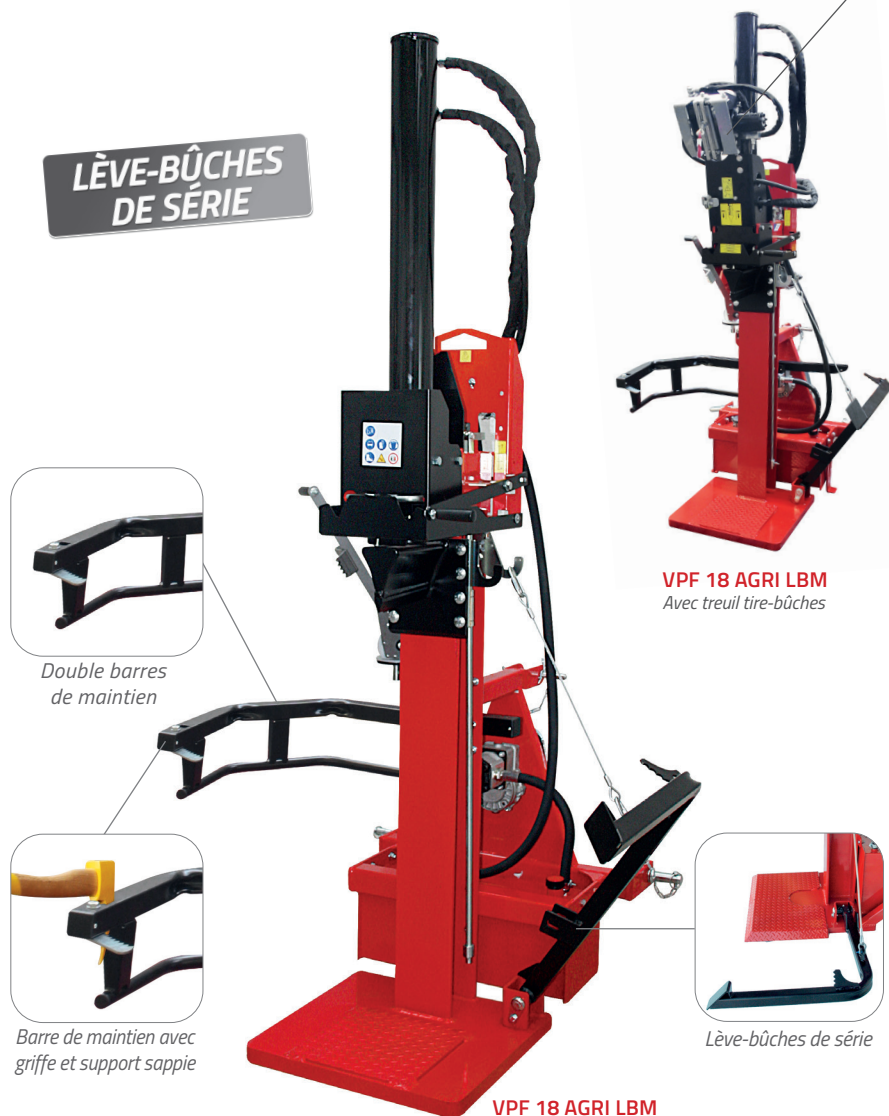
VPF 18 AGRI LBM Avec treuil tire-bûches