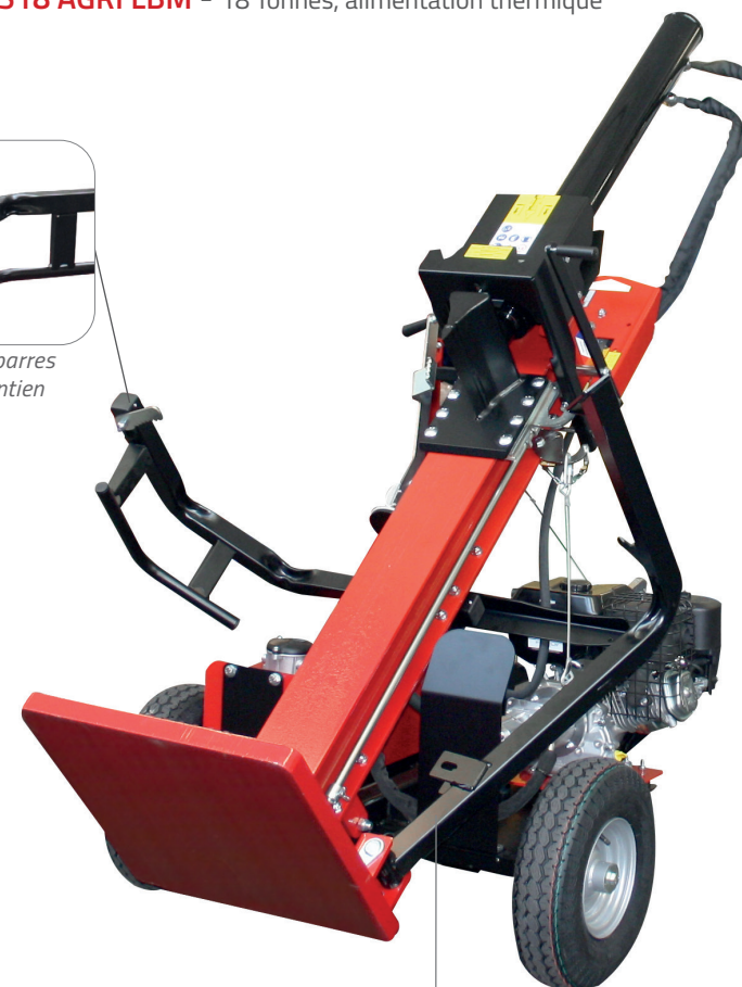
VMR-S18 AGRI LBM